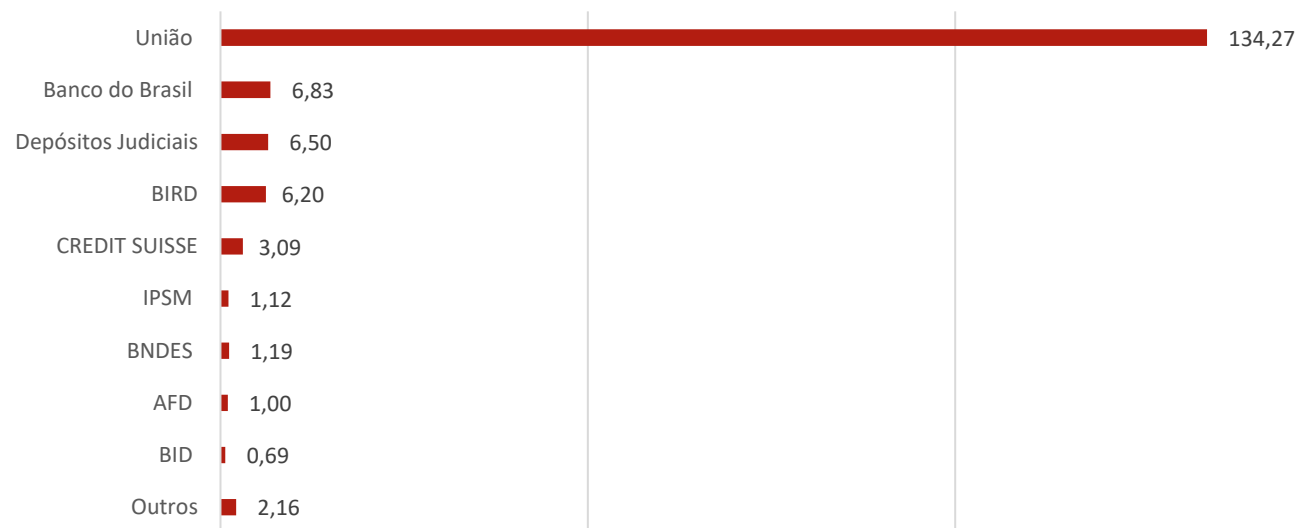
Estoque da dívida por credor

1- CAM – Coeficiente de Atualização Monetária relativo ao contrato de financiamento – Lei nº 9.496/97, baseado na Lei Complementar nº 148/2014 e Decreto nº 8.616/2015.