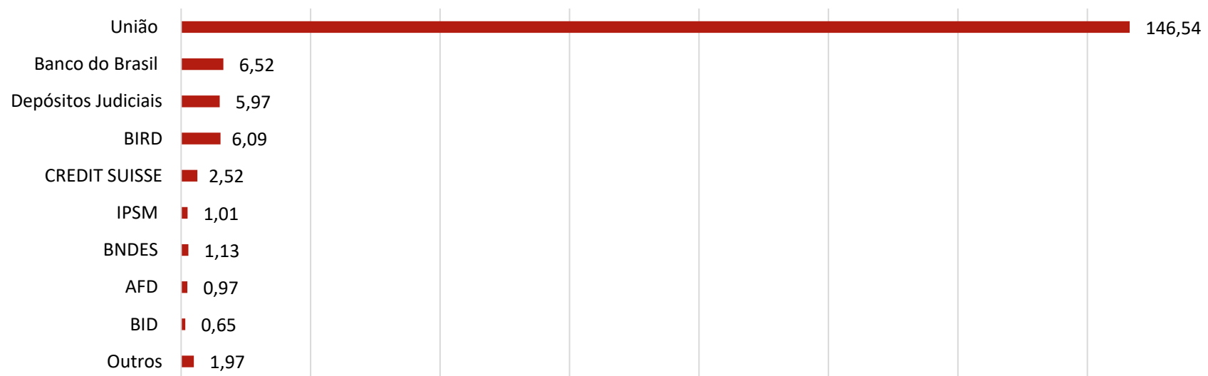
Estoque da dívida por credor

1- CAM – Coeficiente de Atualização Monetária aplicado aos contratos de refinanciamento de dívida com a União – Lei 9.496/1997; LC 178/2021 e LC 159/2017.