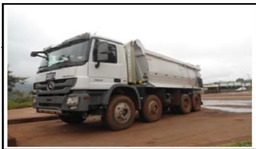
CAMINHAO BRANCA DIESEL 6 X 4